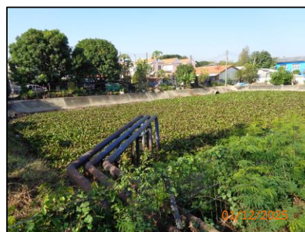
บ่อน้ำฝน