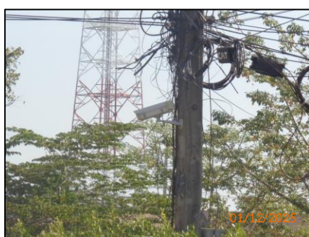
กล่องวงจรปิด