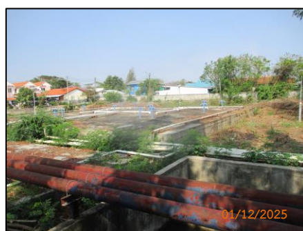
ระบบบำบัดน้ำเสีย