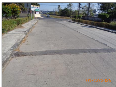
ถนนภายในโครงการ